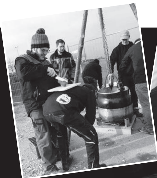
L'équipage du Titanic 2016

Prochaine escale Téléthon à BETTENS 2017, nous leur souhaitons beaucoup de succès.